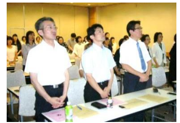
< 全珠連歌斉唱で開会 >

翌日は蕎麦とジャズの里『グリーンプラザなんごう』で、そば打ちを体験。参加した先生方は、美味しく出来た自分の手打ちそばに、舌鼓を打ちました。