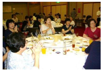
< 盛り上がった、懇親会 >