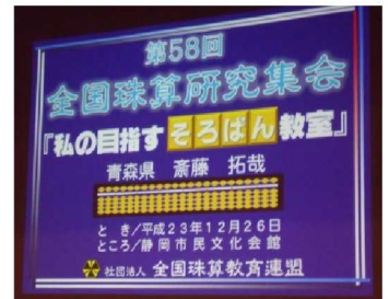
<スクリーンに大きく映し出された様子>