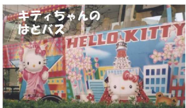
キティちゃんのはとバス