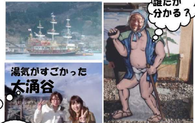
湯気がすごかった大涌谷