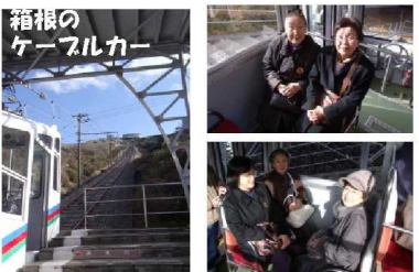
箱根のケーブルカー