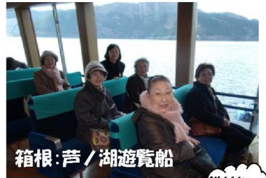
箱根・芦ノ湖遊覧船